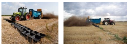
Figure 2 : Epandages des PRO